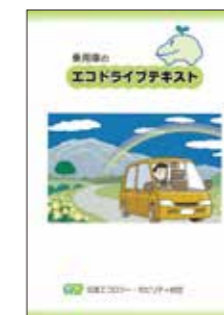
▲乗用車のエコドライブテキスト(200円/冊)