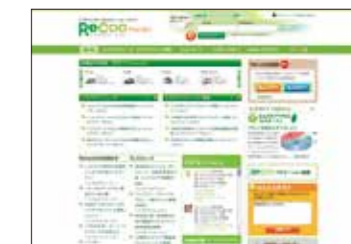
▲燃費管理支援サイトReCoo(無料/別途登録必要)