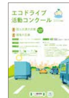
▲コンクールリーフレット(電子データのみで提供)