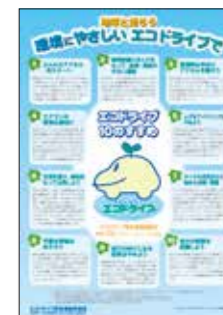
▲エコドライブ10のすすめチラシ(無料)