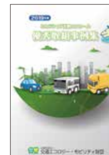
▲優秀取組事例集(電子データのみで提供)(無料)