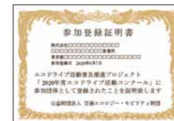
▲コンクール参加登録証明書(電子データのみで提供)