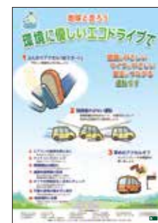
▲エコドライブ10のすすめポスター(無料)