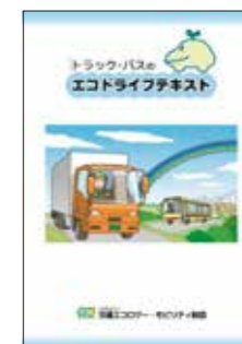
▲トラック・バスエコドライブテキスト(200円/冊)